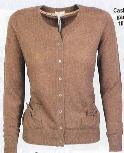
Cashmerecardigan fra Life Is til 1.095 kr.