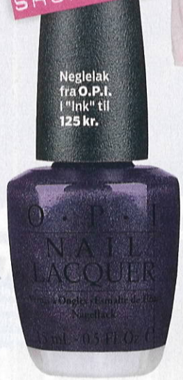
Neglelak fra O.P.I. i "Ink" til 125 kr.