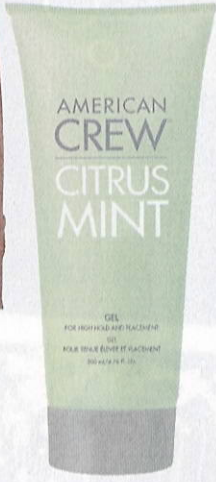
Citrus Mint Gel fra American Crew til 121, 50 kr.