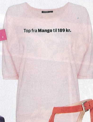
Top fra Mango til 189 kr.