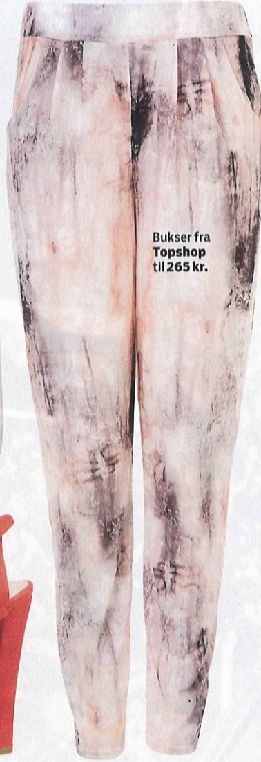
Bukser fra Topshop til 265 kr.

Den smukke skuespillerinde solgte for nylig ud af sin garderobe hos Fashionistas i København, og hun var hoppet i et trendy sæt med mønstrede bukser, som vi straks må gøre efter.