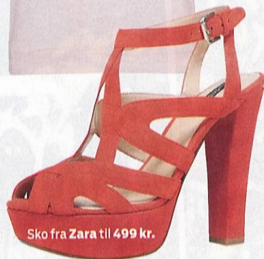
Sko fra Zara til 499 kr.